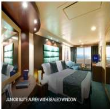
JUNIOR SUITE AIREA WITH SEALED WINDOW