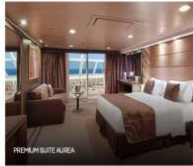
PREMIUM SUITE AIREA