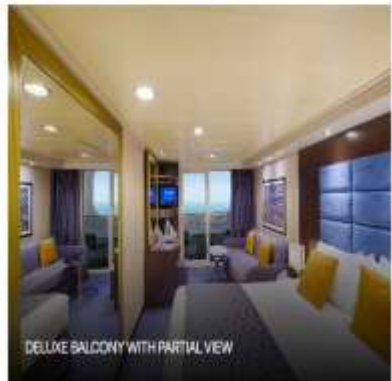
DELUXE BALCONY WITH PARTIAL VIEW