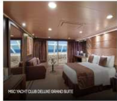
MSC YACHT CLUB DELUXE GRAND SUITE