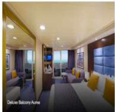
Deluxe Balcony Airea