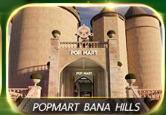
POPMART BANA HILLS

สัมผัสความงามหมู่บ้านฝรั่งเศสที่บานาฮิลล์ ช้อปปิ้ง POPMART เยือนเมืองโบราณฮอยอัน ล่องเรือกระดิง วัดหลินอึ้ง สะพานมังกร