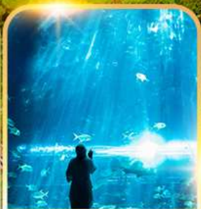
อควาเรียม