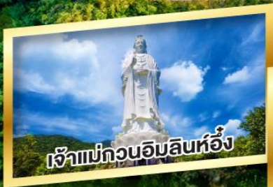
เจ้าแม่กวนอิมสินห่อ้ง