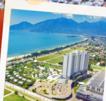
Mikazuki Japanese Resorts & Spa