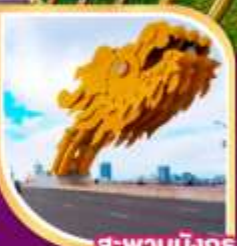
สะพานมังกร

28 พ.ย. - 01 ธ.ค. 67 07-10 ธ.ค.67 ( วันรัฐธรรมนูญ ) 23-26 ม.ค.68, 06-09 ก.พ.68 13-16 มี.ค.68