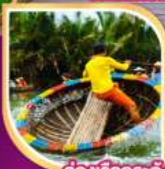
ล่องเรือกระต๊อง