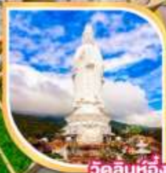
วัดลินห์ฮื่อง