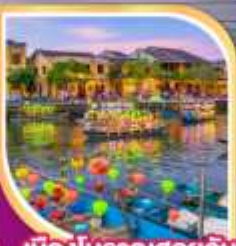
เมืองโบราณฮอยอัน