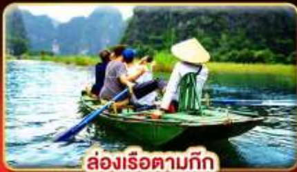
ล่องเรือตามทิว