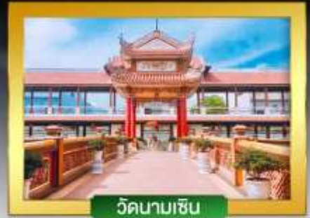
วัดนามเชิน