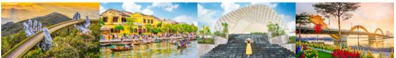
บานาฮิลล์