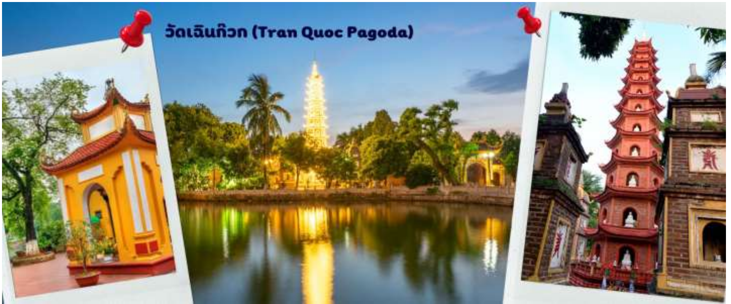
วัดเลนทีกว (Tran Quoc Pagoda)

จากนั้นให้ท่านได้ อิสระช้อปปิ้ง ถนนสาย 36 street แหล่งช้อปปิ้งของฮานอย มีต้นไม้ปกคลุมสองฝั่งถนน สาเหตุที่ชื่อถนน 36 มาจาก 36 อาชีพที่ทำการค้าขายบนถนนแห่งนี้ ตั้งแต่อดีตอย่างงานด้านหัตถกรรมสอดคล้องกับชื่อถนนแต่ปะเล็น ในอดีตอย่าง เครื่องเงิน ผ้าไหม บนถนนแห่งนี้ แต่ปัจจุบันมากกว่า 36 ไปแล้ว ที่นี่จะเป็นแหล่ง Shopping มีสินค้าเกือบทุกชนิด ร้านขายชุดกีฬาที่มีทุกแบรนด์เพราะที่นี่เป็นแหล่งผลิตให้หลาย ๆ แบรนด์