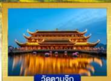
วัดตามจิก