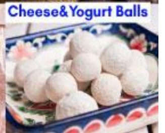
Cheese & Yogurt Balls