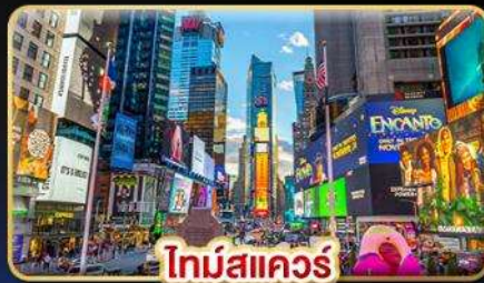
ไทม์สแควร์