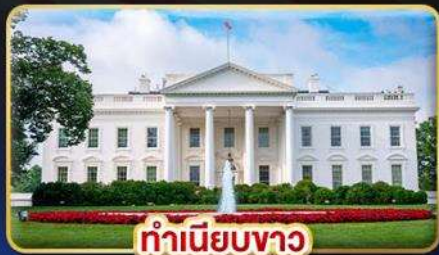
ทำเนียบขาว

ที่สุด "อเมริกาตะวันออก" ชมมหานครนิวยอร์ก ล่องเรื่อน้ำตกไนแอกการ์่า