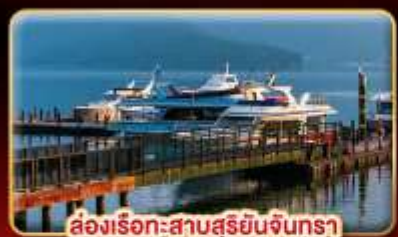
ล้งเรือกะสาบสุริยบินจินกรา

"นังรถไฟชมอุทยานอาลีซาน" ปล่อยคอมลอยเส้นทางรถไฟผิงซี