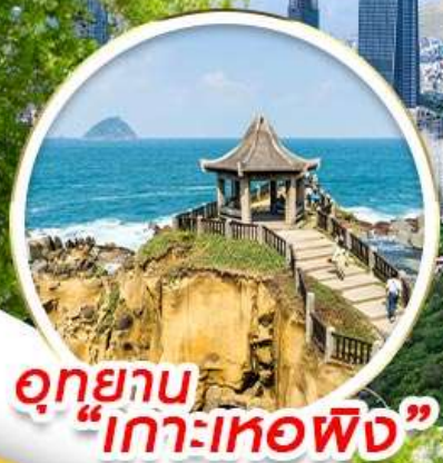
อุทยาน "เกาะเทอฟิ่ง"