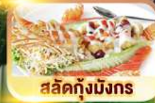
สลัดกุ้งมังกร