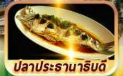
ปลาประจานาริบดี