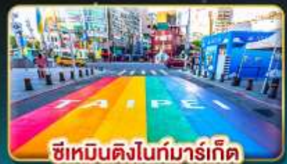
ซีเหมินติงไนท์มาร์เก็ต