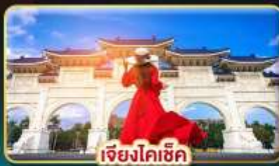
เจียงไคเช็ก