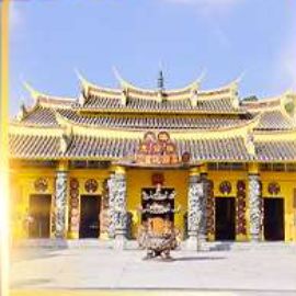
วัดซอพรเทพเจ้า