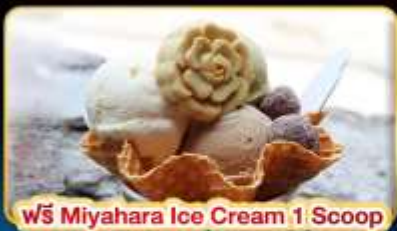
ฟรี Miyahara Ice Cream 1 Scoop

"ขอความรักวัดหลงซาน" ปล่อยคอมลวยเส้นทางรถไฟผิงซี