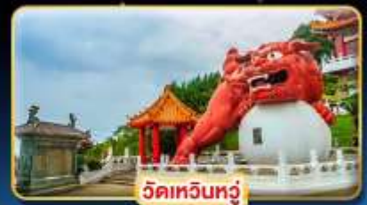
วัดเหวินทง