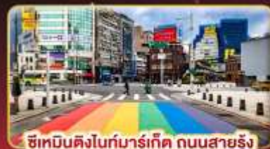
ซีเหมินติงไนท์มาร์เก็ต ถนนสายรุ้ง