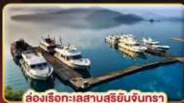
ล่องเรือทะเลสาบสุริยจันทร์