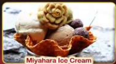
Miyahara Ice Cream