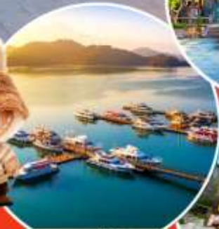
ทะเลสาบสุริยอินจันตรา