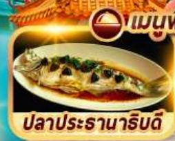
ปลาประธาราธิบดี