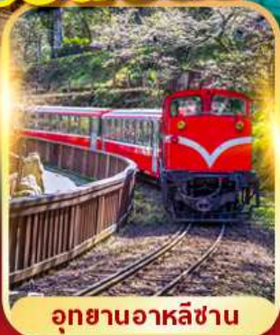
อุทยานอาหลิซาน