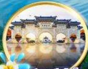
อนุสรณ์สถานเจียงไคเช็ก