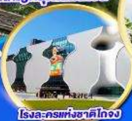
โรงละครแห่งชาติไทจง