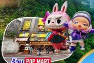
ร้าน POP MART ที่ใหญ่ที่สุดในไต้หวัน