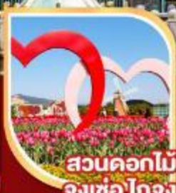
สวนดอกไม้ จงเซ่โกจง