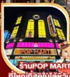
ร้าน POP MART ที่ใหญ่ที่สุดไต้หวัน