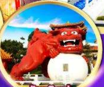
วัดเหวินหัว