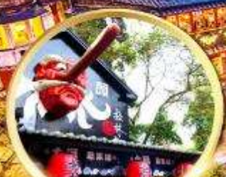
หมู่บ้านปิต่างชไต