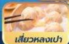
เสี่ยวหลงเป่า