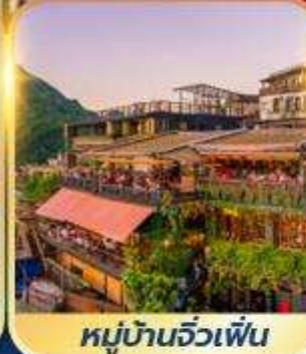
หมู่บ้านจิวเฟิ่น