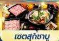
เซตสุกชามู