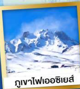
ภูเขาไฟเอซียส์