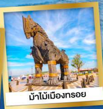
ม้าไม้เมืองทรอย