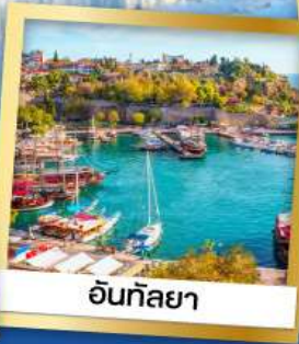
อันกัลยา