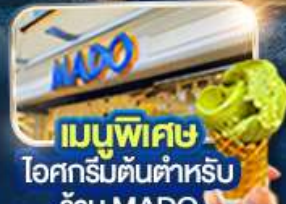
เมนูพิเศษ ไอศกรีมต้นตำหรับ ร้าน MADO