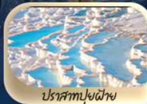
ปราสาทฟูยฟ้า