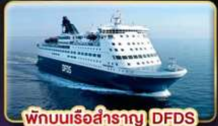
พักบนเรือสำราญ DFDS