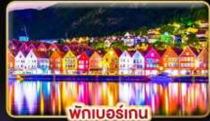
พักเบอร์เกน