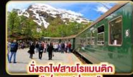
นั่งรถไฟสายโรแมนติก “ฟรอมสปาน่า”