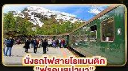
นั่งรถไฟสายโรเมนติก "ฟรอมสมาเนา"