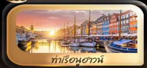
ท่าเรือฮาวน์