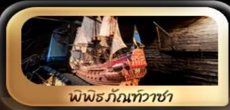
พิพิธภัณฑ์ทิวาชา