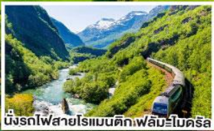
นั่งรถไฟสายโรแมนติกเฟลัมโบเดครัล