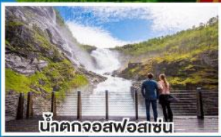
น้ำตกจอสฟอสเซ่น