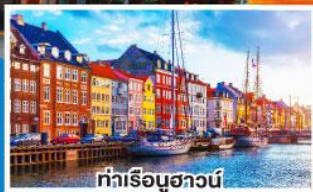
ท่าเรือชวานน์