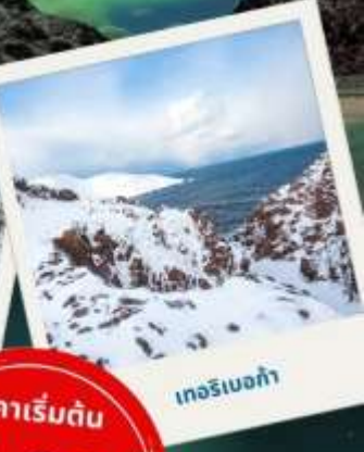
เทอริเบอก้า