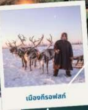
เมืองก็รอฟสค์