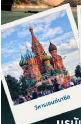
วิหารเซนต์บาซิล