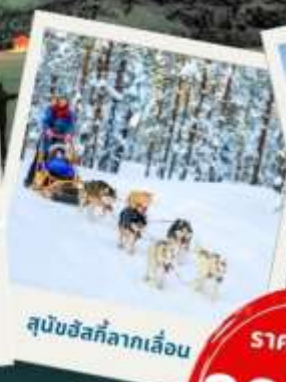
สุนัขซึลล์ลากเลื่อน