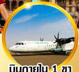
บินภายใน 1 ขา