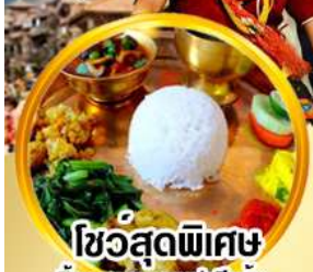
ไขว่สุดพิเศษ ลิ้มรสอาหารเนปาลแท้ๆ

ดินแดนศักดิ์สิทธิ์กลางห้อมกอดหิมาล้น สัมผัสสถาปัตยกรรมอันวิจิตรงดงาม กาฐมัณฑุ โภครา ภัคตาปัวร์ ปาทัน นากาเทียต