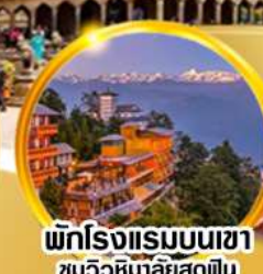
พักโรงแรมบนเขา ชมวิวหิมาลือสุดฟิน