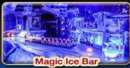
Magic Ice Bar