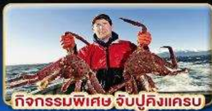
กิจกรรมพิเศษ จับปูคิงแคส