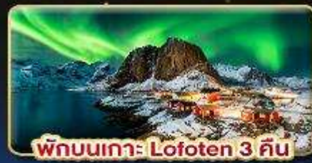
พักผ่อนเกาะ Lofoten 3 คืน