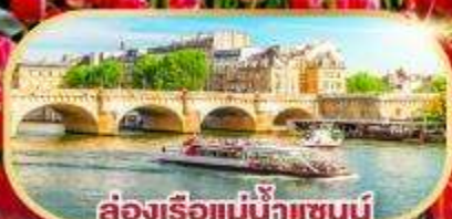
ล่องเรือแม่น้ำแซนน์