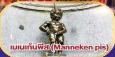
แมนเนกันพีส (Manneken pis)