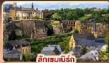
ลักเซมเบิร์ก