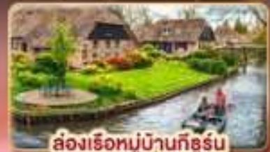
ล่องเรือหมู่บ้านกังหัน