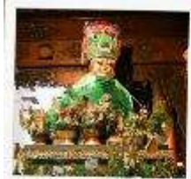
ขอพรแม่ย่า

สักการะ 3 มหาบูชาสถาน ที่สุดแห่งศรัทธาของชาวพุทธ