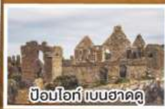
ป้อมโอ๊ก์ เบนฮาดดู