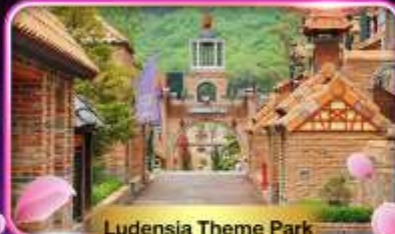
Ludensia Theme Park