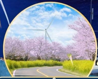
ซากุระ / ทุ่งดอกเรป