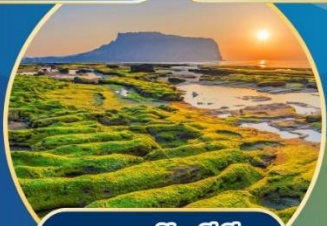
นาตดอชิงชีกี