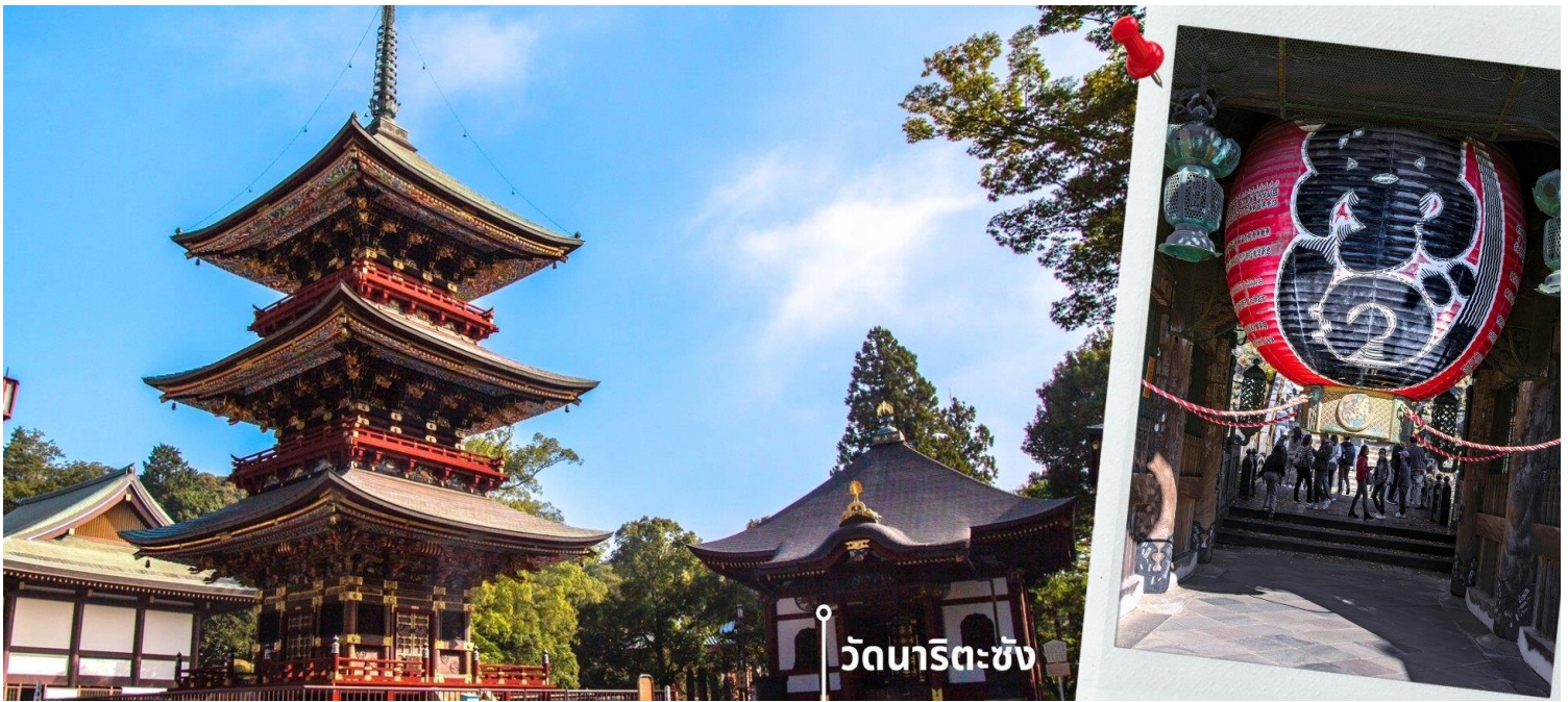
วัดนาริตะซัง

จากนั้นนำท่านเดินทางไปยัง AEON MALL ภายในตัวห้างมีร้านค้าต่างๆมากถึง 150 ร้านซึ่งตกแต่งในรูปแบบที่ทันสมัย สไตล์ญี่ปุ่นสินค้ามากมายหลากหลายให้เลือกตั้งแต่เสื้อผ้าแฟชั่นอาหารสดใหม่และอุปกรณ์ภายในบ้านรวมถึงเครื่องสำอางค์ขนมญี่ปุ่นต่างๆและยังมีร้านค้ามากมายไม่ว่าจะเป็น Muji, 100 yen shop, Sanrio store, Capcom games arcade และก็ยังมีซูเปอร์มาร์เก็ตขนาดใหญ่ให้ท่านได้เลือกซื้อของ