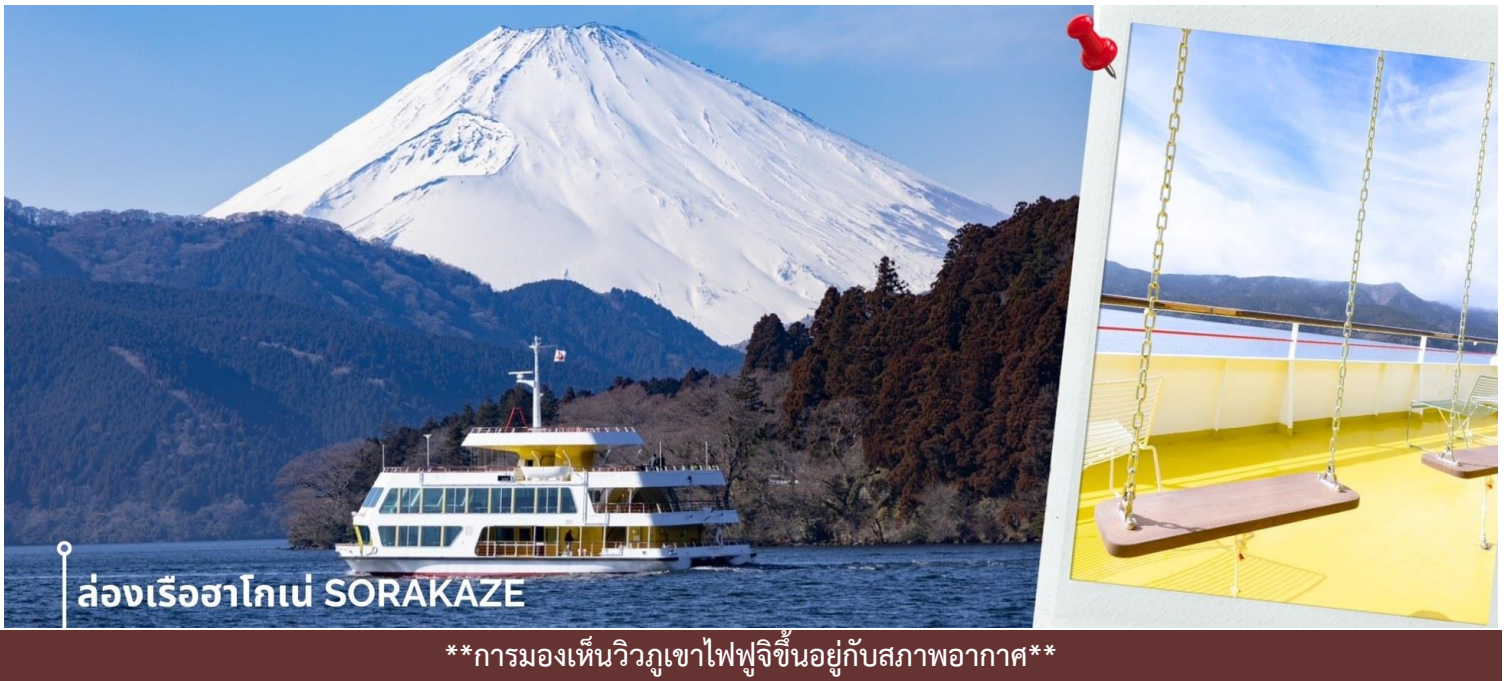
ล่องเรือฮาโกเน่ SORAKAZE

หลังรับประทานอาหารเที่ยง พาท่านเดินทางสู่ ทะเลสาบอาชิ ซึ่งเป็นทะเลสาบที่ล้อมรอบไปด้วยธรรมชาติที่อุดม สมบูรณ์และวิวกุภูเขาฟูจิ เป็นหนึ่งในทะเลสาบที่สวยงามที่สุดในญี่ปุ่น ในประวัติศาสตร์เชื่อกันว่าทะเลสาบแห่งนี้เกิดขึ้นจาก การปะทุของภูเขาไฟเมื่อประมาณ 3100 ปีก่อน ปัจจุบันเป็นแหล่งท่องเที่ยวในฮาโกเน่ พาท่าน ล่องเรือฮาโกเน่ SORAKAZE โดยเรือลำนี้ได้มีการรีโนเวทใหม่ในชื่อ Hakone Maru และมีการปรับปรุงลักษณะเรือลำใหม่ โดยออกแบบ เรือให้มีความเป็นมิตรต่อสิ่งแวดล้อมและเข้ากันกับทิวทัศน์ที่สวยงามของภูเขาไฟฟูจิ รวมถึงใช้เชือกมงคล Mizuhiki ดัด เป็นรูปร่างกระเรียน ซึ่งเป็นอัตลักษณ์สำคัญที่สะท้อนถึงความเป็นญี่ปุ่น ภายในห้องโดยสารชั้น 2 ถูกออกแบบมาให้ สามารถชมบรรยากาศภายนอกได้อย่างชัดเจนด้วยกระจกบานใหญ่ ชั้นบนถูกแต่งให้เหมือนสวนสาธารณะ ทั้งกระถาง ต้นไม้ ม้านั่ง ชิงช้า ให้ท่านได้ชมวิวกุทิวทัศน์และธรรมชาติรอบๆทะเลสาบ และในวันที่ฟ้าเปิดยังสามารถมองเห็นฟูจิซึ่ง จากตรงนี้ได้อีกด้วย โดยจะล่องจากท่าเรือ HAKONE SEKISHO - ท่าเรือ MOTOHAKONE ก่อนจะพาท่านขึ้นฝั่ง