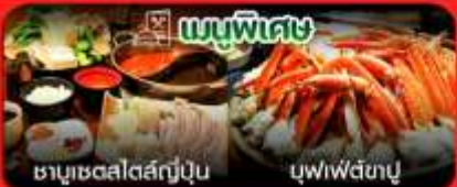
เมนูพิเศษ ซาซิมิสดปลาทูน่า ซูชิพิเศษ

หมู่บ้านน้ำใส โอชิโนะ อิกโก-พิพิธภัณฑ์แผ่นดินไหว-ศาลเจ้าฮาโกเน่-ไถเวอร์ซิติ โอไดบะ-วัดฮาซากุสะ-ช้อปปิ้งชินจูกุ-ตลาดปลานาคามินาโตะ-อิจิออนมอลล์