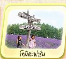
โทมิตะฟาร์ม