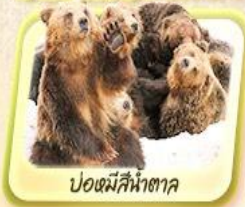
บ่อหมีสีน้ำตาล