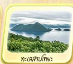
ทะเลสาบโทยะ