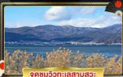
จุดชมวิวกะเลสาบสุวะ