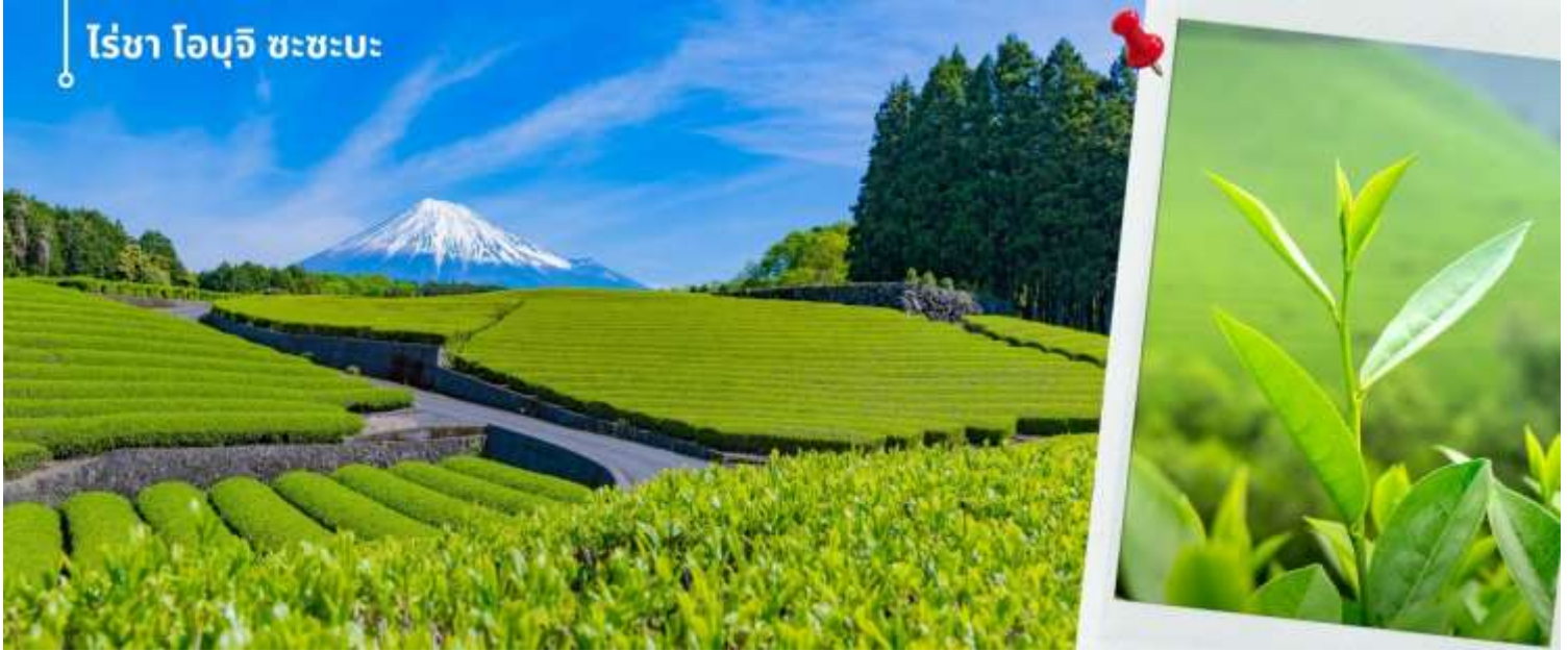
ไร่ชา โอบุจิ ซะซะบะ

หลังรับประทานอาหารเที่ยง นำท่านเดินทางสัมผัสบรรยากาศไร่ชาสไตล์ญี่ปุ่น “มัทฉะ (Matcha)” เป็นรสชาติที่ได้รับความนิยม มีต้นกำเนิดอยู่ในญี่ปุ่น ผลิตขึ้นจากชาเขียวหรือที่เรียกว่า “เรียวกุฉะ (Ryokucha)” และสถานที่ซึ่งเป็นแหล่งผลิตชาเขียวที่มีชื่อเสียงแห่งหนึ่งในญี่ปุ่น ไร่ชาโอบุจิ ซะซะบะ (Obuchu Sasaba) ตั้งอยู่ใกล้กับภูเขาไฟฟูจิ ในจังหวัดชิซุโอกะ (Shizuoka) ที่รู้จักกันดีว่าเป็นภูมิภาคที่มีการผลิตชาชั้นนำของประเทศญี่ปุ่น ไร่ชาแห่งนี้โดดเด่นในเรื่องของวิวทิวทัศน์ที่สวยงาม ในวันที่ฟ้าเปิด จะสามารถมองเห็นภูเขาไฟฟูจิได้อีกด้วย บรรยากาศที่สวยงามกับไร่ชาสีเขียวพร้อมกับพื้นหลังเป็นภูเขาไฟฟูจิ ให้ท่านได้อิสระเก็บภาพบรรยากาศภายในไร่ชา ตามอัธยาศัย