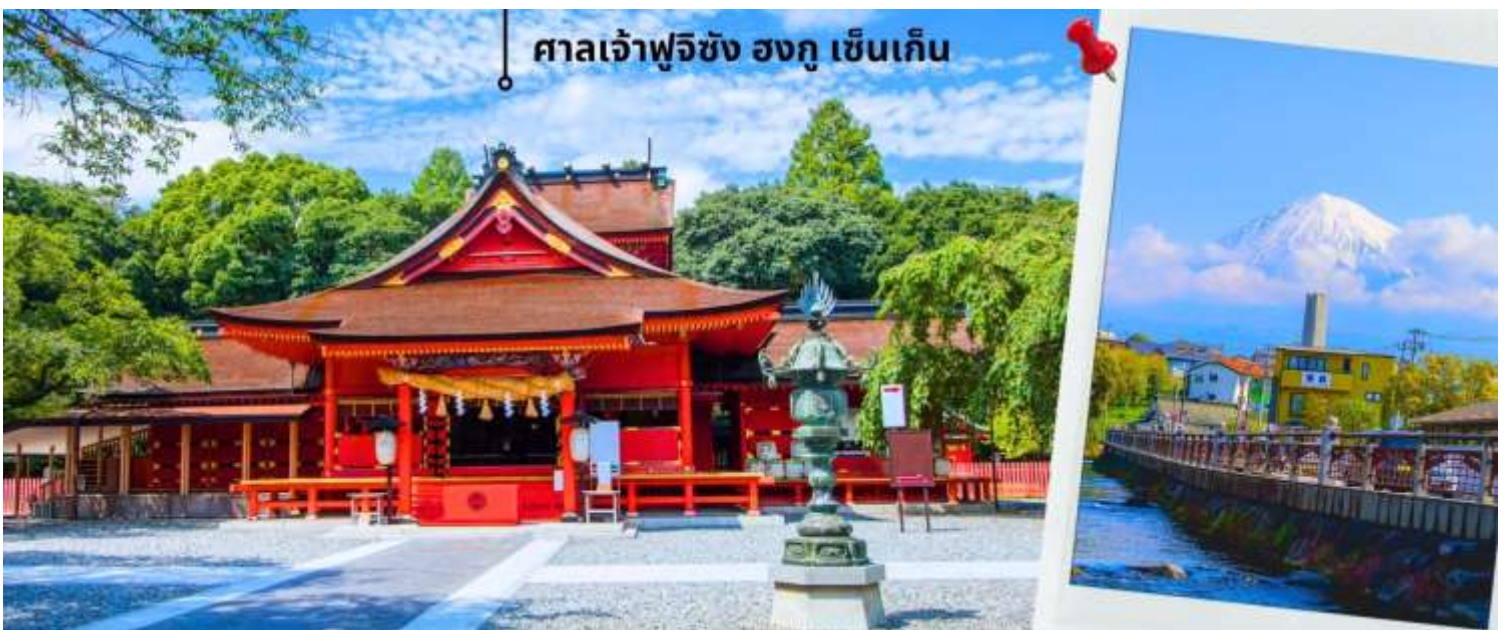
ศาลเจ้าฟูจิซัง ฮงกุ เซ็นเก็น

จากนั้นนำท่านไปสักการะ ศาลเจ้าฟูจิซัง ฮงกุ เซ็นเก็น ไทฉะ (Fujisan Hongu Sengen Taisha) ศาลเจ้าอายุเก่าแก่กว่า 1,000 ปี สร้างขึ้นเพื่อเป็นการบวงสรวงเทพเจ้าของภูเขา เพื่อให้หยุดการปะทุของภูเขาไฟฟูจิในช่วงที่มีการระเบิด ถือเป็นศาลเจ้าที่สำคัญที่สุดของภูมิภาค นอกจากนี้ศาลเจ้าฟูจิซัง ฮงกุ เซ็นเก็น ไทฉะ ยังเป็นส่วนหนึ่งของมรดกโลกทางวัฒนธรรมภูเขาฟูจิ