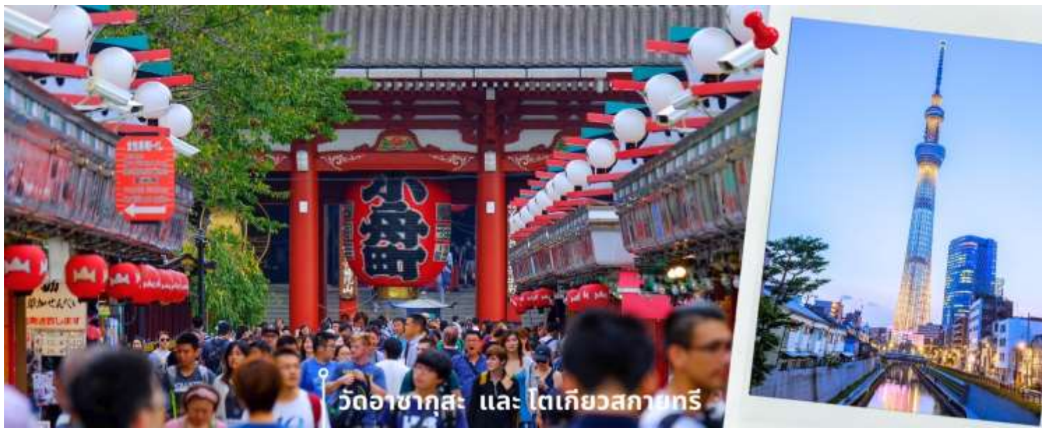
วัดอาซากุสะ และ โตเกียวสกายทรี

08.00 น. เดินทางถึงสนามบินนาริตะ ประเทศญี่ปุ่น หลังจากผ่านพิธีตรวจคนเข้าเมืองและศุลกากรแล้ว นำท่านขึ้นรถโค้ชปรับอากาศ จากนั้นเดินทางสู่ เมืองโตเกียว พาท่านสักการะ ที่ วัดอาซากุสะ (Asakusa Temple) วัดที่ได้ชื่อว่าเป็นวัดที่มีความศักดิ์สิทธิ์และได้รับความเคารพนับถือมากที่สุดแห่งหนึ่งในกรุงโตเกียวภายในประดิษฐานองค์