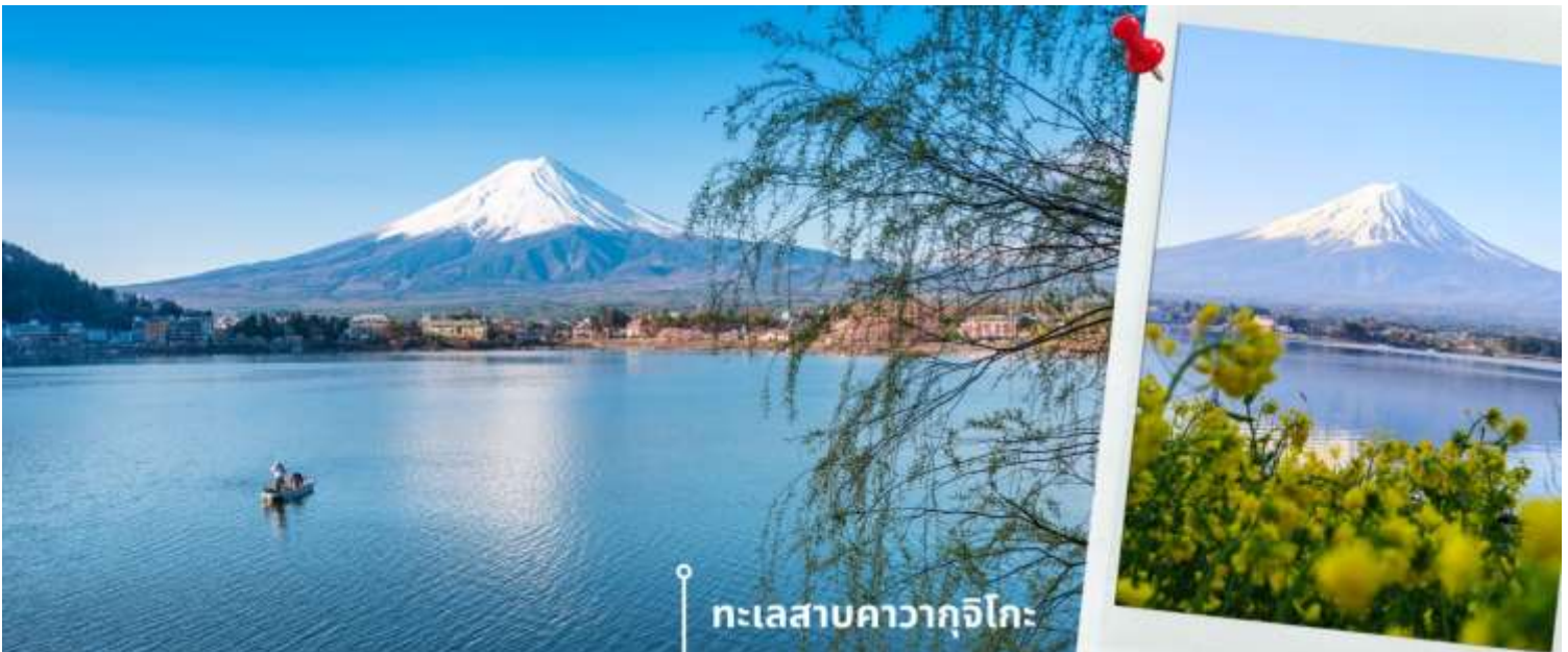
ทะเลสาบคาวากูจิโกะ

หลังรับประทานอาหารเช้า นำท่านแวะชม พิพิธภัณฑ์แผ่นดินไหว เป็นพิพิธภัณฑ์ที่แสดงถึงผลกระทบจากภัยพิบัติแผ่นดินไหวและการระเบิดของภูเขาไฟ ภายในพิพิธภัณฑ์มีห้องจัดแสดงข้อมูลการประทุของภูเขาไฟจากทุกมุมโลก โซนความรู้ต่างๆและโซนข้อปั้งสินค้าญี่ปุ่นอาทิเช่น ผลิตภัณฑ์เครื่องสำอางและของฝากอีกมากมาย พอสมควรแก่เวลานำท่านเดินทางสู่ ทะเลสาบคาวากูจิโกะ (Lake Kawaguchiko) ในจังหวัดยามานาชิ แหล่งท่องเที่ยวที่อยู่ไม่ไกลจากโตเกียว (Tokyo) หนึ่งในที่ที่เยวญี่ปุ่นยอดฮิตตลอดกาล ทะเลสาบที่กว้างใหญ่เป็นอันดับ 2 ของ 5 ทะเลสาบรอบภูเขาไฟฟูจิ อยู่บริเวณเชิงภูเขาไฟ ความสูงกว่าระดับน้ำทะเลประมาณ 800 เมตร ทำให้สภาพอากาศบริเวณนี้เย็นสบายตลอดปี รายล้อมไปด้วยธรรมชาติที่อุดมสมบูรณ์ และทิวทัศน์สวยงามตลอดปี ในช่วงเวลาที่พลาดไม่ได้เลยที่จะได้ชื่นชมดอกซากุระบาน คือในช่วงปลายเดือนมีนาคมจนถึงต้นเดือนเมษายน จะบานสะพรั่งสวยงามเรียงรายริมทะเลสาบสามารถชมวิวดูทั้งทะเลสาบและภูเขาไฟฟูจิได้อย่างชัดเจน นับเป็นจุดชมซากุระยอดฮิตที่สุดอีกแห่งหนึ่งในญี่ปุ่น