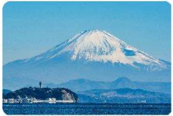
เกาะเอโนะชิมะ

เมืองคามาคุระ (Kamakura) เมืองน่ารักติดทะเล ตอบโจทย์ที่เที่ยวที่ผสมผสานระหว่างประวัติศาสตร์ ธรรมชาติ และความงามของทะเล บอกเลยใครมาต้องตกหลุมรักกับเมืองสุดชิล อย่าง คามาคุระ เมืองเล็กๆ ที่ตั้งอยู่ทางตอนใต้ของจังหวัดคานากาวะ ห่างจากโตเกียวเพียงแค่ 1 ชั่วโมง เท่านั้น แต่เต็มไปด้วยสถานที่ท่องเที่ยว ทิวทัศน์ธรรมชาติ และชายหาดที่งดงาม ที่นี้จะทำให้ทุกคนรู้สึกเหมือนได้ย้อนกลับไปสัมผัสประวัติศาสตร์ญี่ปุ่นในยุคซามูไร พร้อมทั้งได้ผ่อนคลายท่ามกลางบรรยากาศที่เงียบสงบและสดชื่น