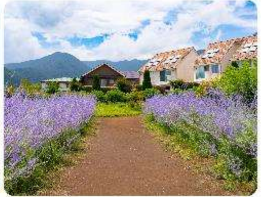
สวนโออิชิ พาร์ค

สวนดอกไม้โออิชิ พาร์ค (Oishi Park) มหัศจรรย์แห่งวิวกุเขาไฟฟูจิ หนึ่งในจุดชมวิวของ กุเขาไฟฟูจิที่สวยงามที่สุดอีกจุดหนึ่ง ที่จะเติมเต็มความสงบและความงดงามของธรรมชาติในญี่ปุ่นเมื่อ ไปเยือน คือสถานที่ที่ไม่ควรพลาด สวนดอกไม้โออิชิ พาร์ค (Oishi Park) แห่งนี้ไม่ได้เป็นเพียง สถานที่ที่มีดอกไม้สวยงามให้เราได้ชื่นชมแล้ว จุดเด่นของสวนนี้คือวิวกุเขาฟูจิที่อยู่เบื้องหลังสวน ดอกไม้สีแสนสดใส ที่บานสะพรั่งในทุกฤดูกาล และยังเป็นมุมที่ทำให้เราได้สัมผัสกับวิวกุเขาฟูจิได้อย่าง ใกล้ชิด จากนั้นนำพาทุกท่านสู่..