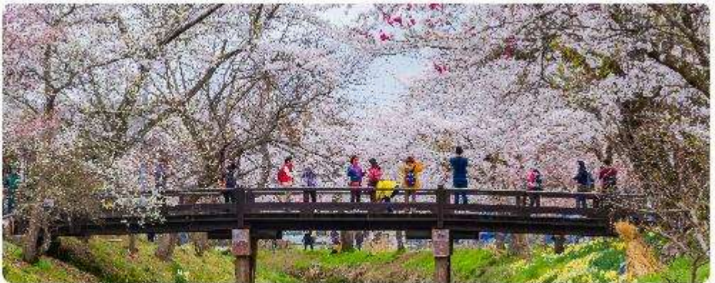
หมู่บ้านน้ำใสโอชิโนะ อักโก

โอชิโนะ อักโก หรือ ที่รู้จักกันในชื่อ หมู่บ้านน้ำใส ความงามแห่งธรรมชาติและวัฒนธรรมที่ ซ่อนอยู่ใต้เงากุเขาไฟฟูจิโอชิโนะ อักโก ตั้งอยู่ในหมู่บ้านโอชิโนะ จังหวัดยามานาชิ ประเทศญี่ปุ่น เป็นแหล่งน้ำธรรมชาติที่มีชื่อเสียง ประกอบด้วยบ่อน้ำใสสะอาดทั้งแปดแห่ง ซึ่งน้ำในบ่อเหล่านี้เกิด จากการละลายของหิมะและน้ำแข็งจากกุเขาไฟฟูจิ น้ำที่ไหลลงมานั้นได้ถูกกรองผ่านชั้นหินกุเขาไฟ