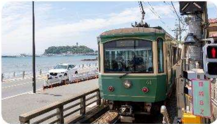
เมืองคามาคุระ