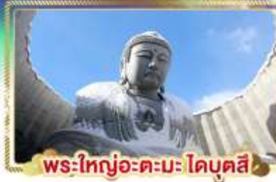
พระใหญ่อะตะมะโคบุตสึ