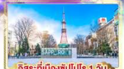
อิสระที่เมืองซัปโปโร 1 วัน