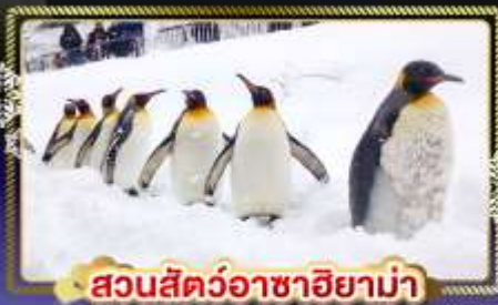
สวนสัตว์อาซาฮิยาม่า