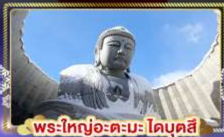
พระใหญ่อะตะมะโดบุตสึ