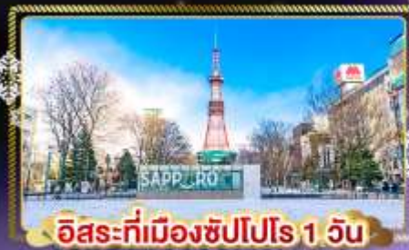
อิสระที่เมืองซัปโปโร 1 วัน