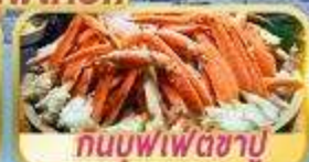
กนบุฟเฟต์ซาบู