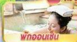
พทอนเซ็น